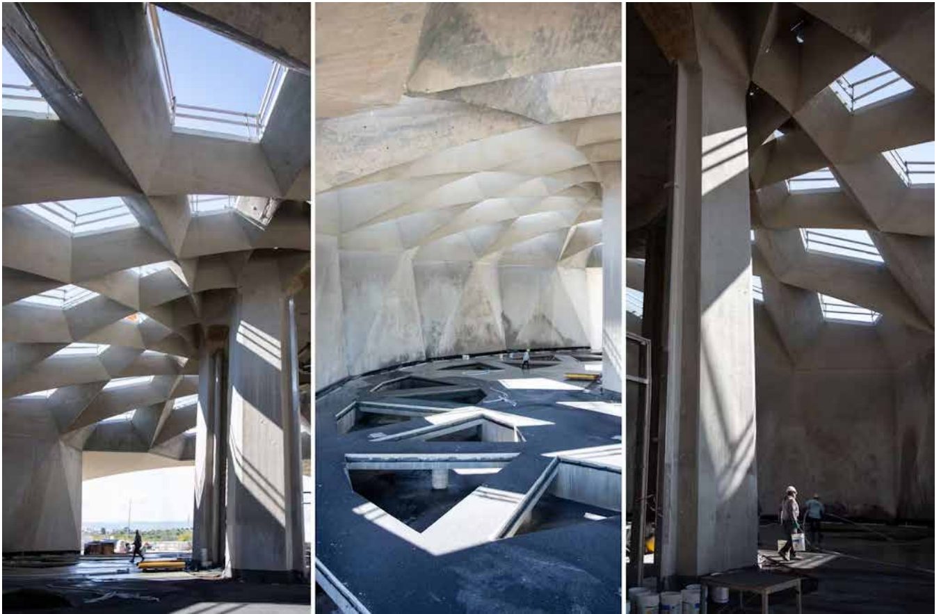
آرامگاه حضرت عبدالبهاء: